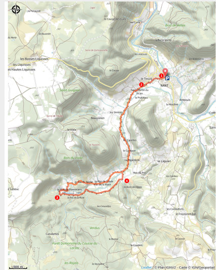
Vers la Source...

Par les petits chemins bucoliques du « jardin de l'Aveyron », cette boucle VTT accessible à tous remonte paisiblement à la source du Durzon, rythmée par le bruissement d'une eau limpide.