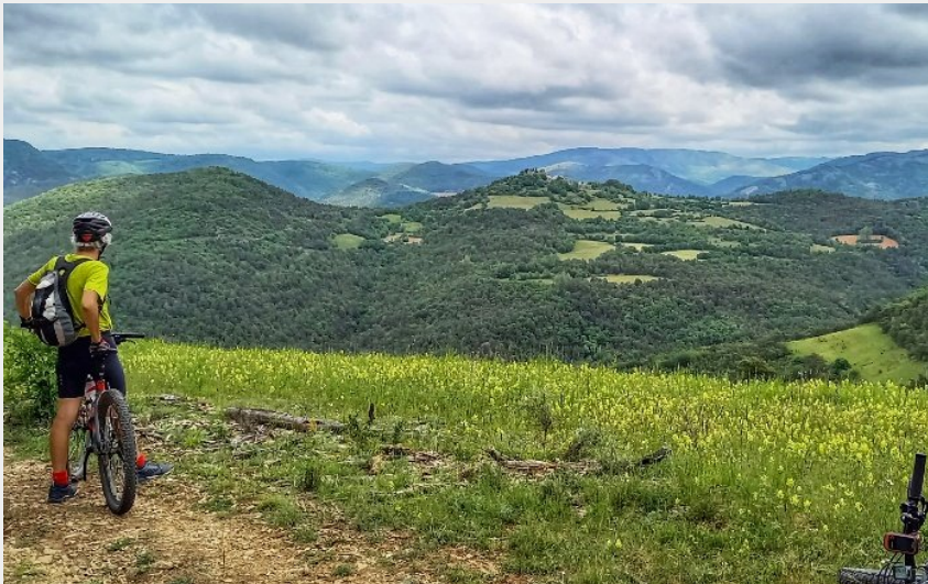
Panorama sur Algues (Agnès Pili)