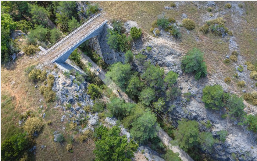
Sur les traces du chemin de fer...