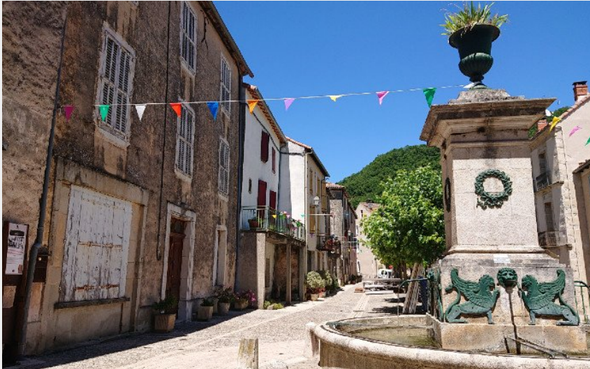
Le quai de Cornus