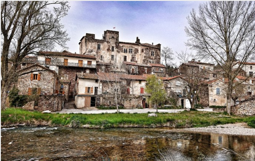
Le château de Latour