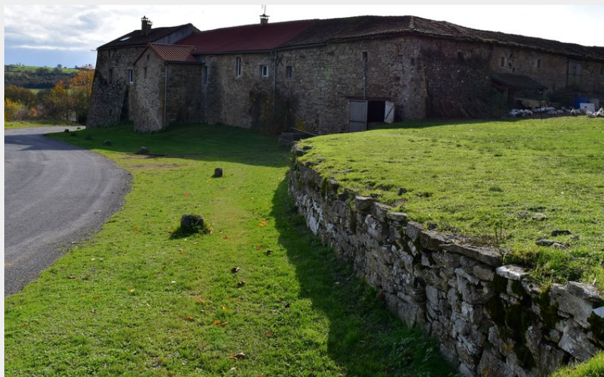
Le ferme de Mascourbes (Elodie Calazel - OT Larzac et Vallées)