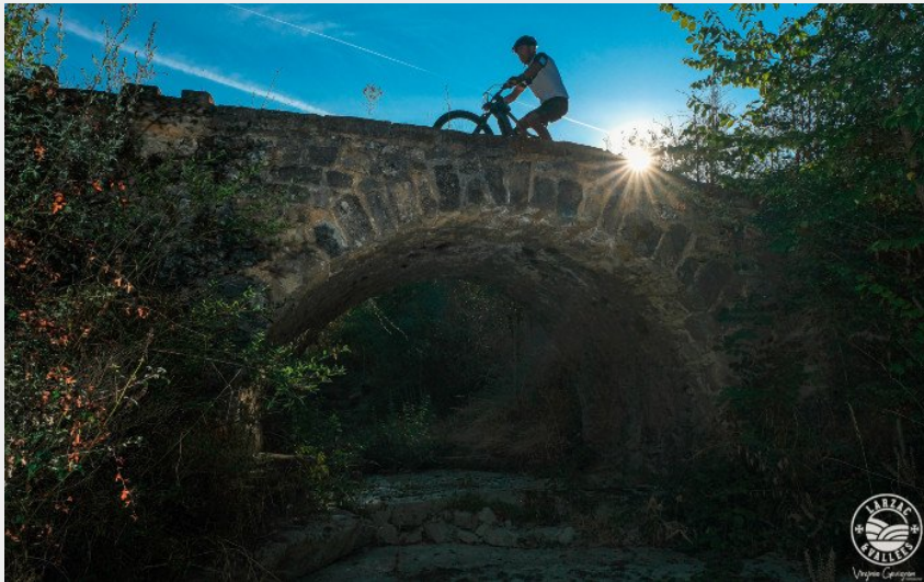
Sur le pont romain