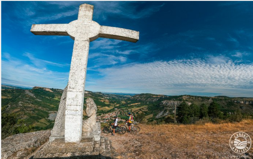
Le panorama depuis la croix de Gréponac