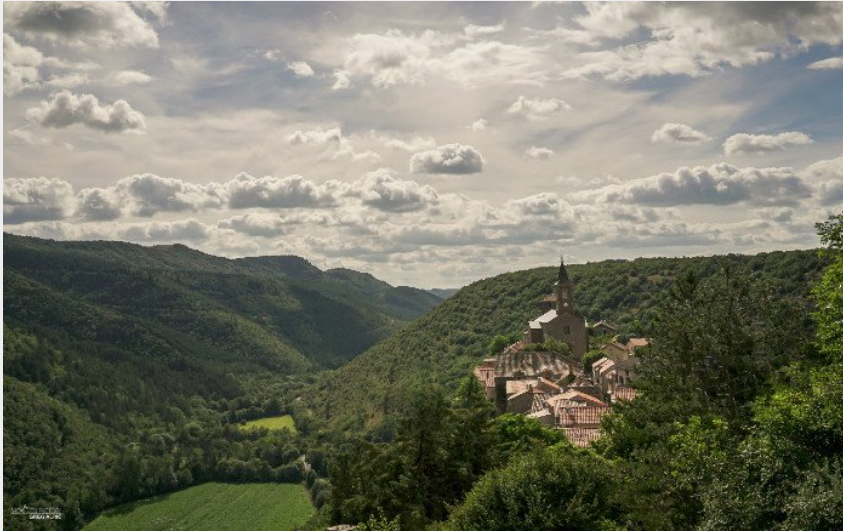
Le village de La Bastide - Pradines