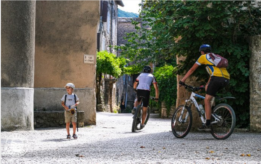
Dans les ruelles de Ste-Eulalie de Cernon