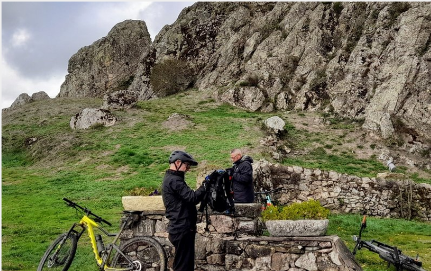
Panorama rocher de la Vierge