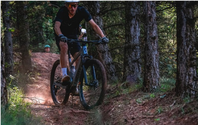
La forêt de St Thomas (V.Govignon)