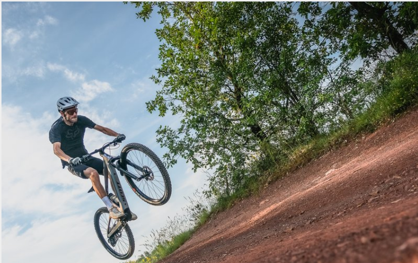
Passages techniques (V.Govignon)