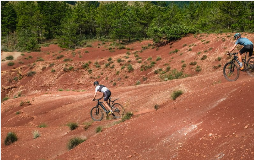
Au cœur du Rougier (V.Govignon)