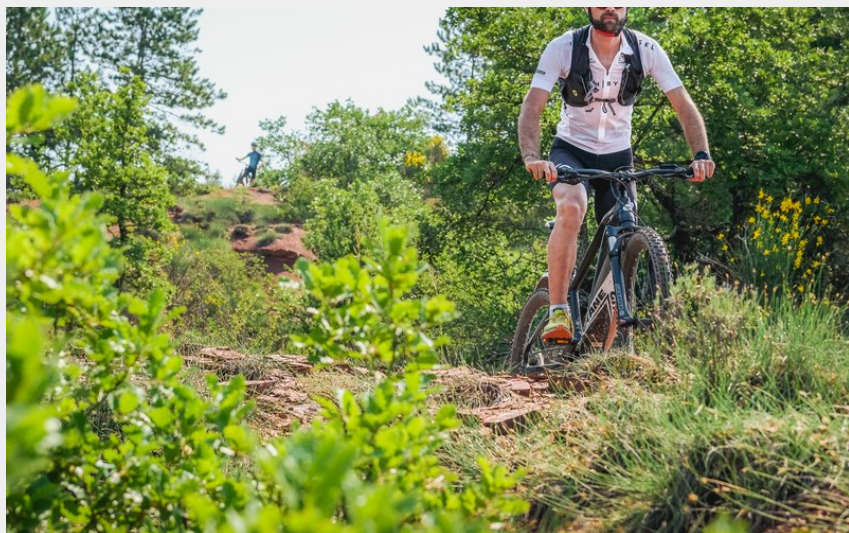
De la Vallée du Rance au Rougier (V.Govignon)