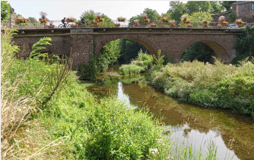
Pont Combret Rance - ©Exo Dams