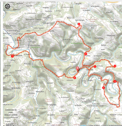
Combret-sur-rance - ©Exo Dams

Technicité requise sur cette grande boucle qui serpente entre sentiers forestiers et lignes de crête et qui vous emmène au monastère Notre-Dame d'Orient au gré d'un jeu de piste patrimonial