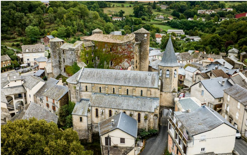
Château de Coupiac (Xavier Waerzeggers)