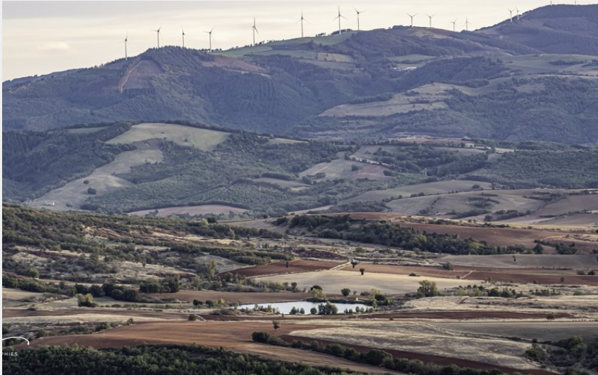
Vue sur le Rougier (Théo Bertrand)