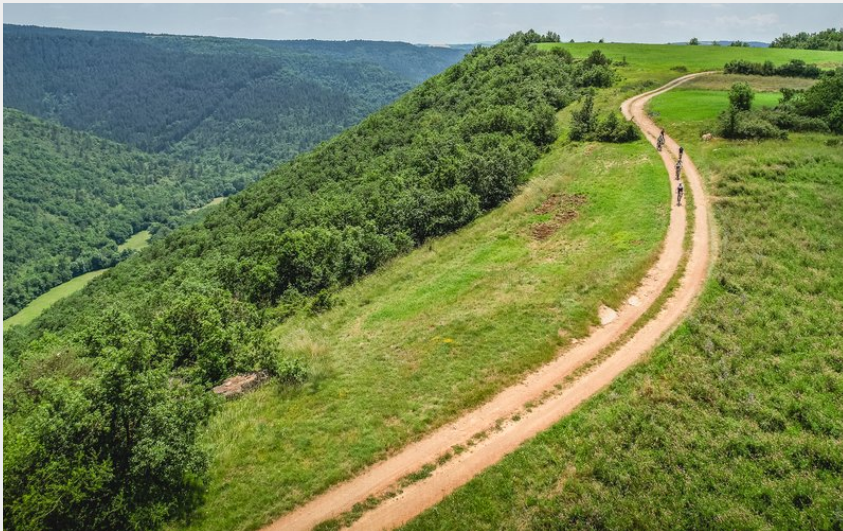
Plateau d'Hermilix (Virginie Govignon)