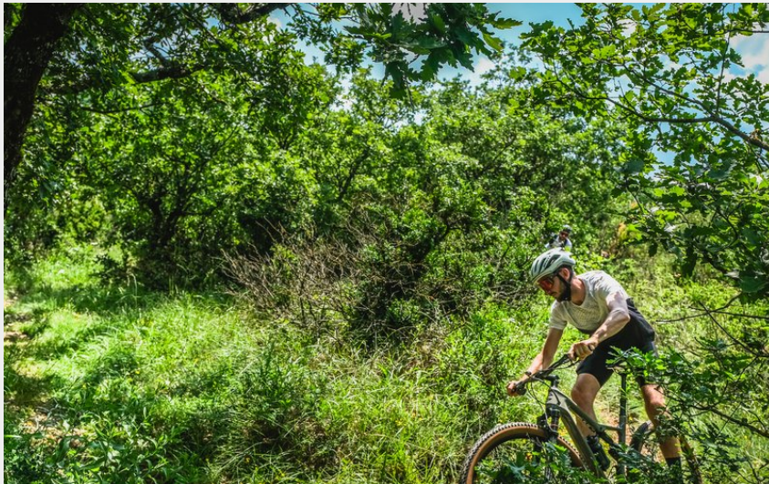
Contreforts de la Loubiere (Virginie Govignon)