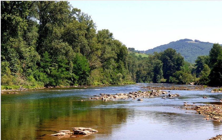
Vue sur le Tarn