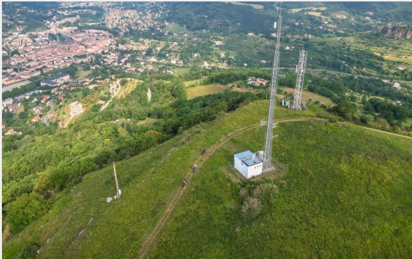
Les relais (Virginie Govignon)