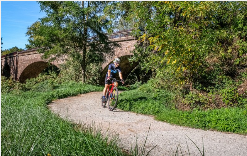
Berges de la Sorgues (Virginie Govignon)