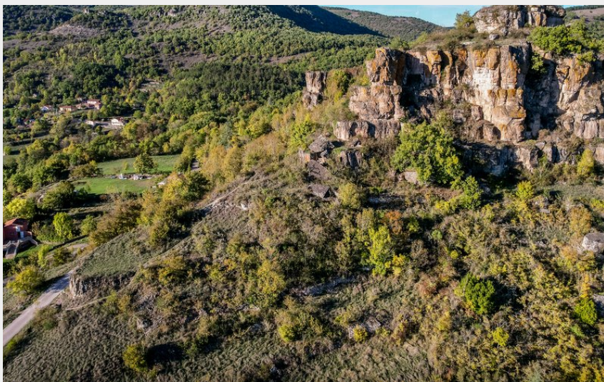
Rocher de Caylus (Virginie Govignon)