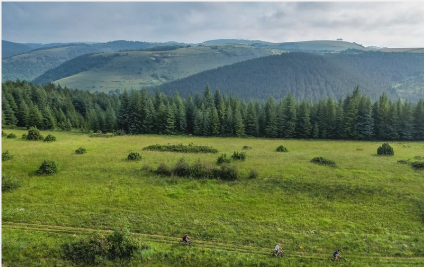
VTT (Roquefort Tourisme)