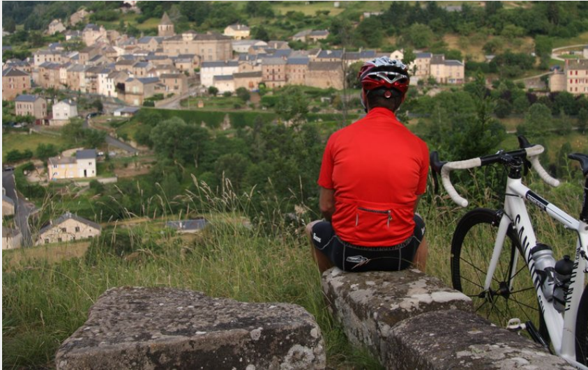
Château de saint Beauzély