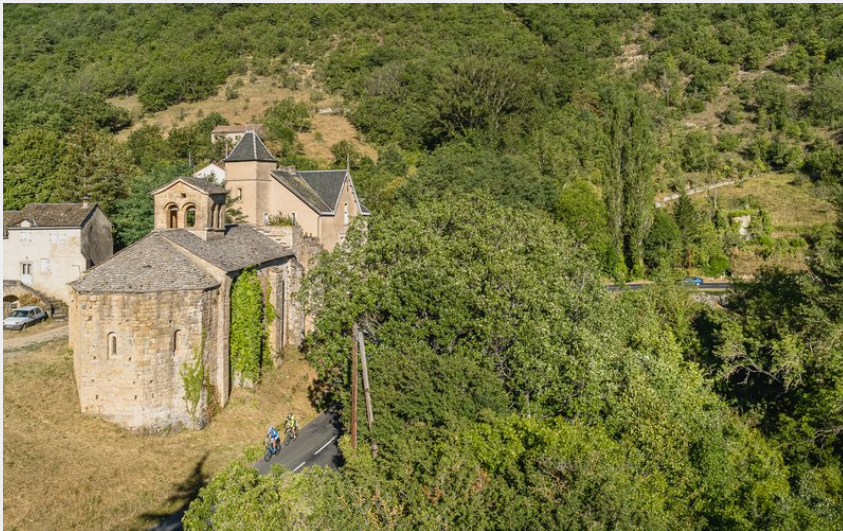
Les cuns, dans la vallée de la Dourbie