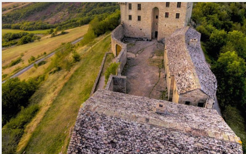
Château de Montaigut (Eric Teissèdre)