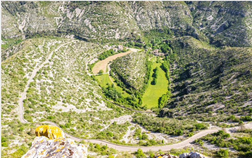
Le Cirque de Navacelles