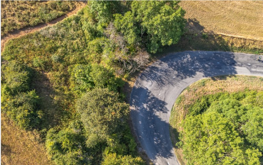
Au détour d'un lacet