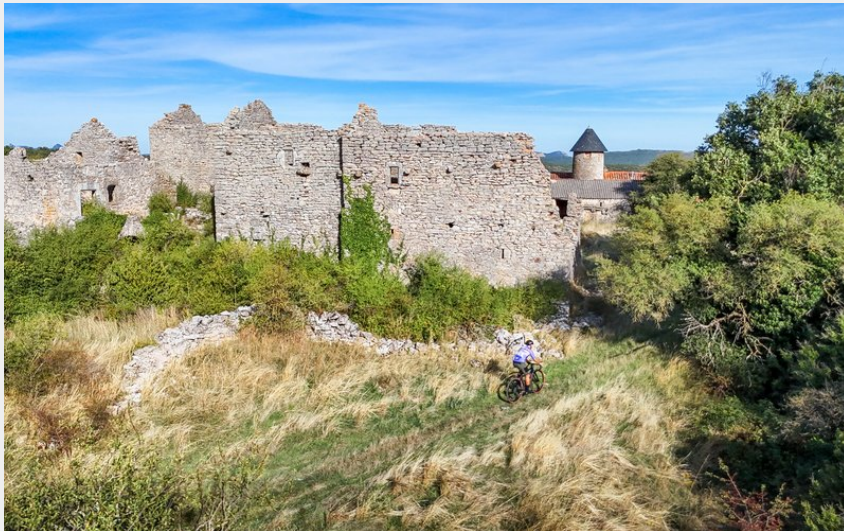
Cycliste gravel proche des ruines à La Vernède