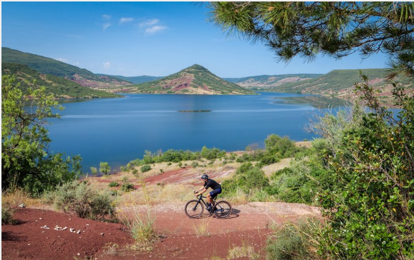
Carte postale Gravel du Lac du Salagou (Eric Brendle)