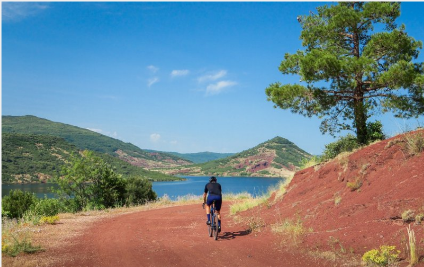
Cycliste sur une piste du Lac du Salagou (Eric Brendle)