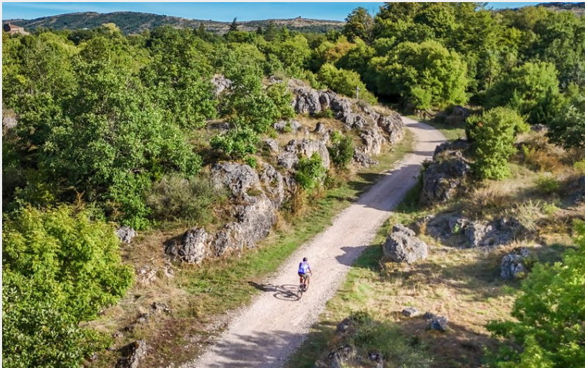
Cycliste gravel sur belle piste du larzac près du Cros (Eric Brendle)