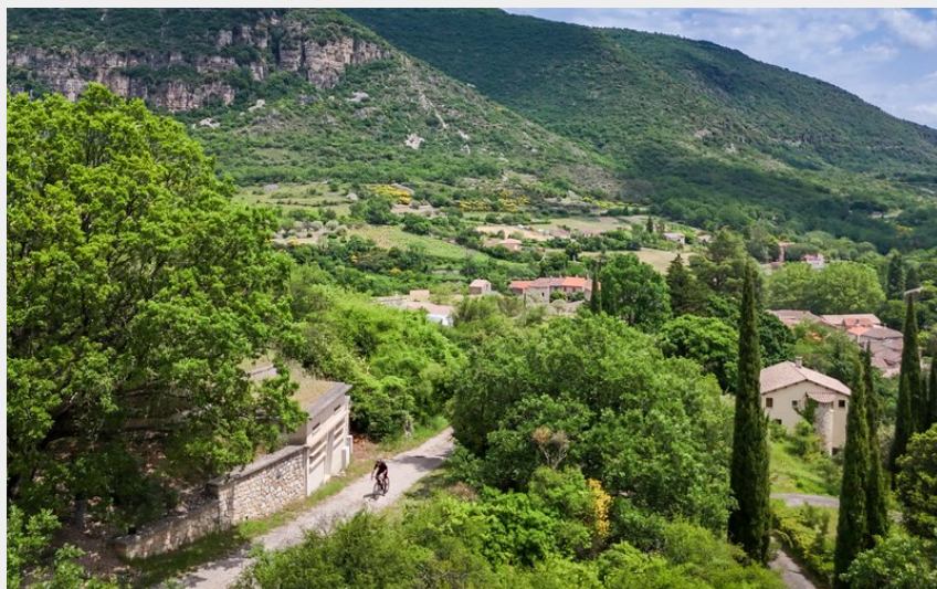
Cycliste gravel sur les hauteurs de Lauroux (Eric Brendle)