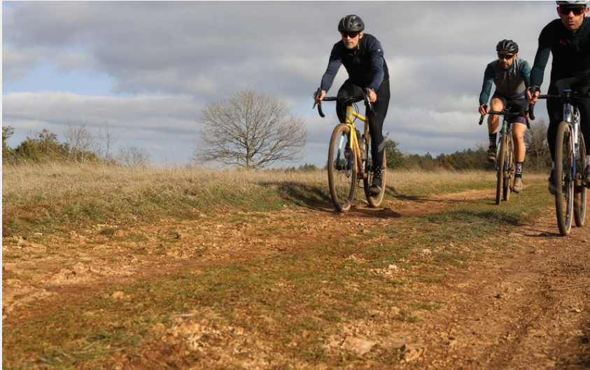
Plateau de la Loubière (CB PNR Grands Causses)