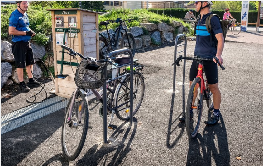
Station service vélos (Virginie Govignon)