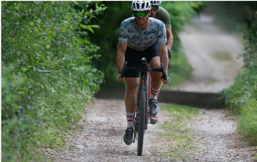
Piste longeant la Dourbie