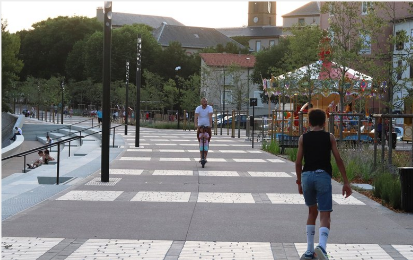
Promenade sur les Quais Sully Challez