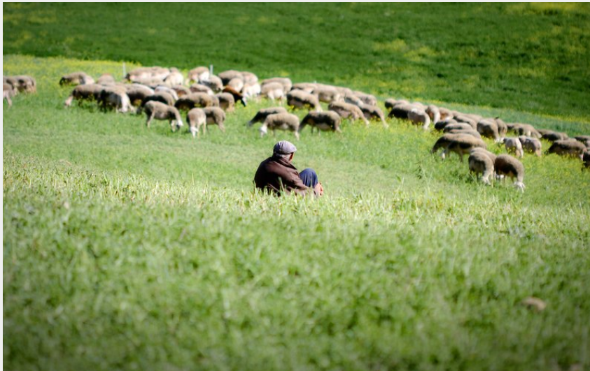
Troupeau de brebis Lacaune (Greg Alric)