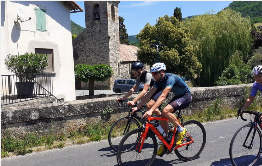
Village de Versols