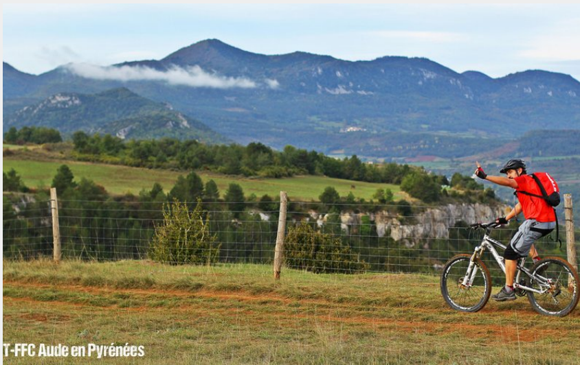
T-FFC Aude en Pyrénées