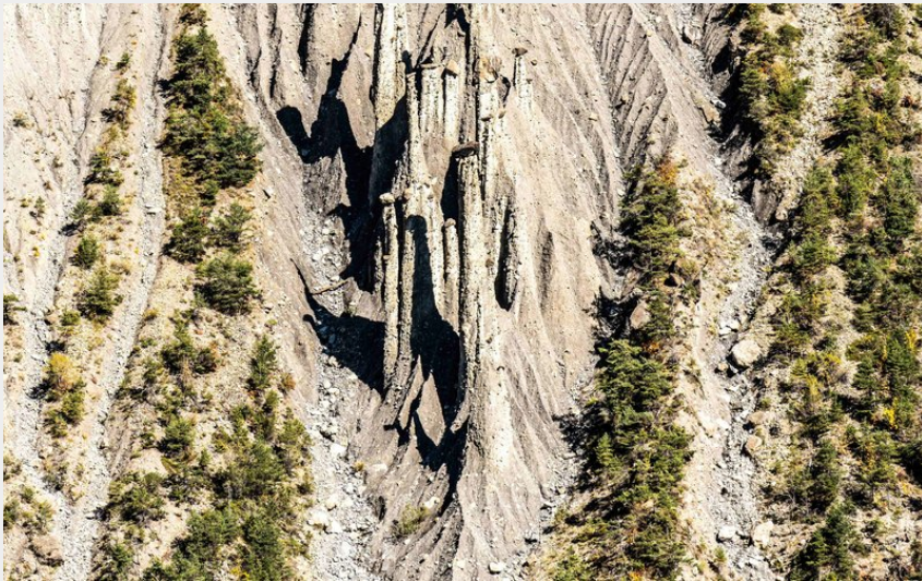
(Rémi Morel - Office de Tourisme de Serre-Ponçon)