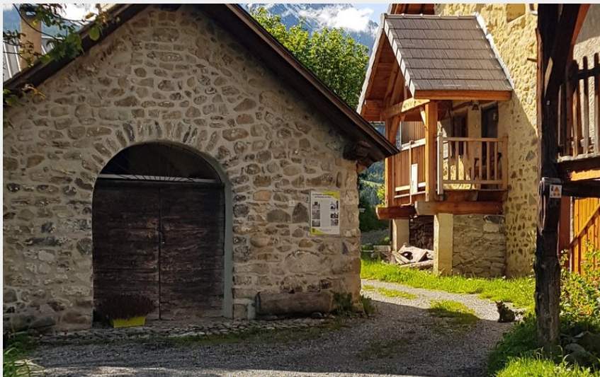
Chapelle et hameau du Bois (Peudon Steven)