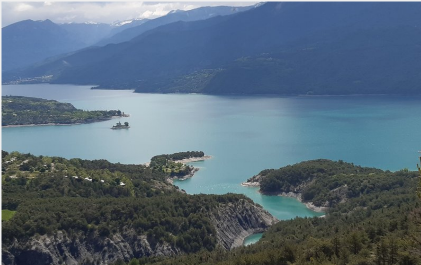
Le pic de Morgon en arrière plan du lac (florimont.tilliere)