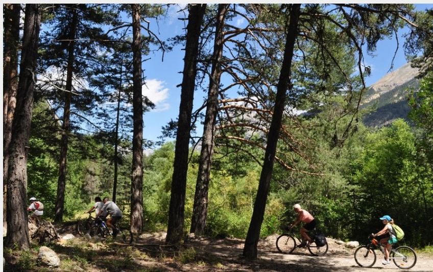
Balade en VTT dans les bois