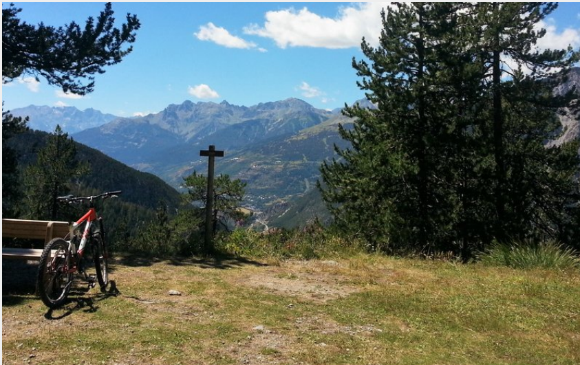
Point de vue sur la Clarée (M. Buffet)