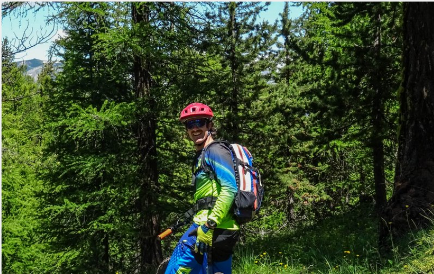
Départ du sentier de descente (M. Buffet)