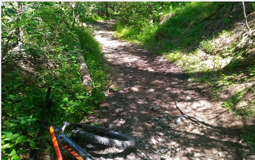
Traversée du Grand Bois du Villar (M. Buffet)